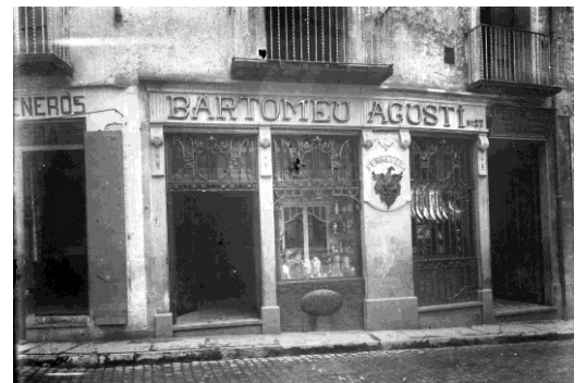
Vista frontal de la façana de la ferreteria Bartomeu Agustí, 1919