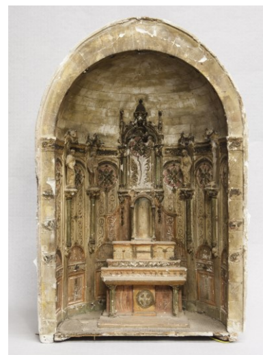
Vista frontal de la maqueta de l'altar major de l'església de Santa Eulàlia, a Begudà, 2018