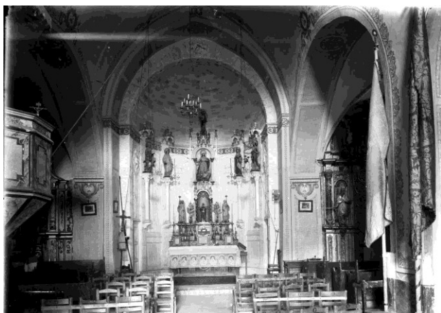
Vista frontal de l'altar major de l'església de Santa Eulàlia, a Begudà, 1919 (ACGAX. Fons Sadurní Brunet Pi. Autor: Sadurní Brunet)

Obres donades per la família (any 2018) i fotografies de l'època relacionades