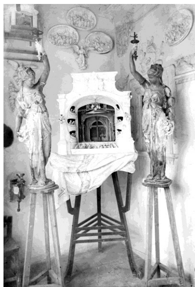
Vista frontal frontal de la maqueta de l'embocadura d'un teatre, c.1909 (ACGAX. Fons Sadurní Brunet Pi. Autor: Sadurní Brunet)