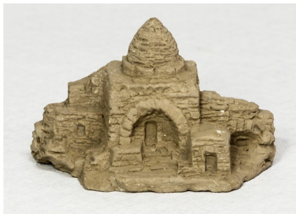
Vista frontal d'una caseta de pessebre, 2018