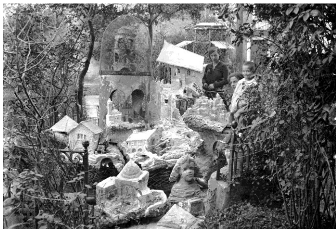
Vista del taller de Sadurní Brunet, c. 1929