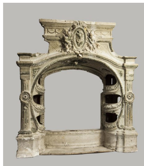
Vista frontal frontal de la maqueta de l'embocadura d'un teatre, 2018